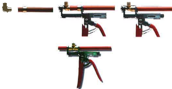
Figure 5 - Réalisation des assemblages